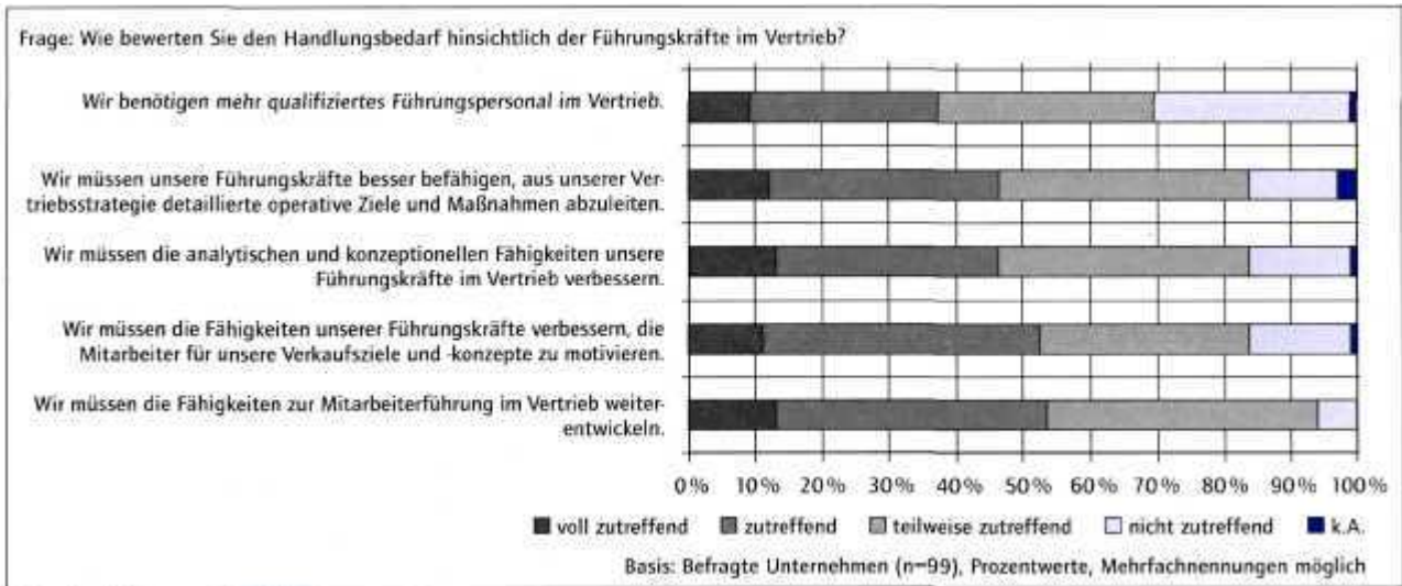
Grafik 1: Handlungsbedarf hinsichtlich der Führungskräfte im Vertrieb

Deutschland gibt es heute deutlich weniger Druckereien als vor zehn Jahren." Teils, weil Betriebe endgültig ihre Pforten schlossen, teils, weil sie fusionierten, teils weil Betriebe ins Ausland verlagert wurden. „Also stehen auch die Zulieferer der Druckunternehmen vor der Herausforderung, sich entweder neue Geschäftsfelder oder Märkte zu erschließen oder den Lieferumfang mit den Kunden in ihrem angestammten Markt zu erhöhen – etwa, indem sie ihnen Zusatzleistungen anbieten.“